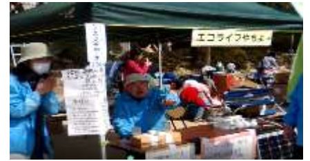
勝田桜祭りでエコクッキングと太陽光発電の体験