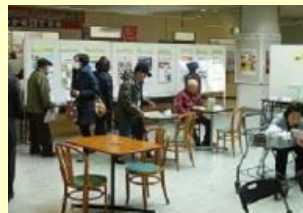
ボランティアによろこ