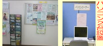
情報・パソコンコーナー