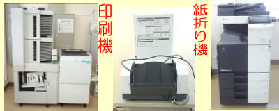
印刷・作業コーナー