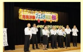
フェスタDe愛フォーラム