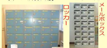
ロッカー・メールボックス