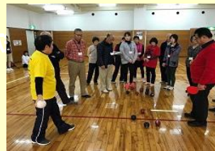
テーマ別交流会(健康増進・介護予防)