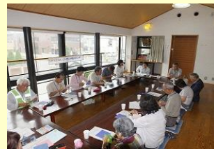
分野別交流会(子どもの健全育成)