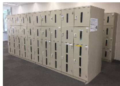
↑ロッカーは共同事務室の中に設置しています。 (大20個、小80個あります)