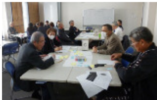
意見をまとめて発表準備をしています