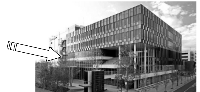
埼玉県東部地域振興ふれあい拠点施設「ふれあいキューブ」 (埼玉県と春日部市の複合拠点施設)