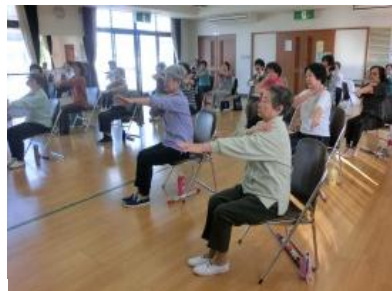
「のびのび元気体操」

参加者にはチャレンジシートとシールが配られ、目標を達成するとその日にシールを貼ってもらいました。