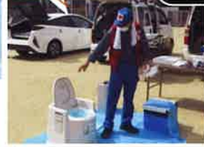
分散避難のための準備物