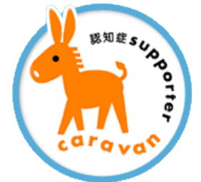
認知症サポーターキャラバン

テーマ: 認知症サポート養成講座 みんなで学ぼう認知症のこと! 講師: 高松市地域包括支援センター職員 13:30~(受付13:00~) 会場: 浅野コミュニティセンター 2階和室