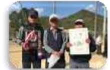
(国分寺町体育協会)